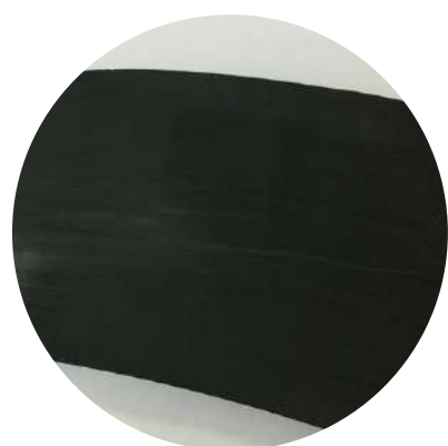
Стружка качественной трубы

Подделку можно обнаружить при торцевании трубы в процессе стыковой сварки по наличию бугристости и неоднородностей окраски в тонком срезе на просвет. Это возникает при смешении неокрашенного полиэтилена с возможными примесями (мел, опилки) и сажей.