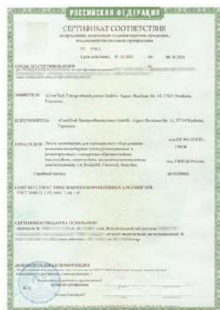
Бланк сертификата соответствия при обязательной сертификации