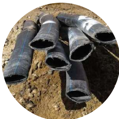
Потеря эксплуатационных характеристик